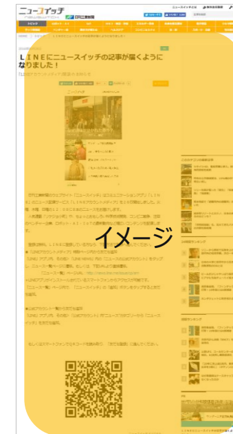
ニュースイッチ記事体広告

⇒TOPページ表示2週間（その後アーカイブページへ） ※掲載開始時期は要相談。 ※詳細は、ニュースイッチメディアガイドP12をご覧ください。