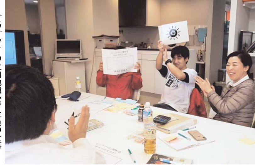
ビッグアイの社内勉強会。社員の仕事にSDGsが直結

2019年5月、千葉を訪れ、愛犬との撮り物の幕張地区で活動。影会やドッグショーをする有志団体「Bay」楽しんだ。