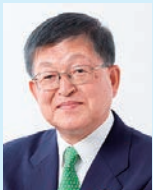
笹谷 秀光 氏 社会情報大学院大学 客員教授 CSR/SDGs コンサルタント